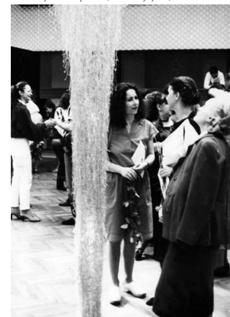
VI Plenerowa Ogólnopolska Wystawa Tkaniny Artystycznej, Inauguracja VII Ogólnopolskiego Pleneru Tkackiego ART-STILON, wrzesień 1984