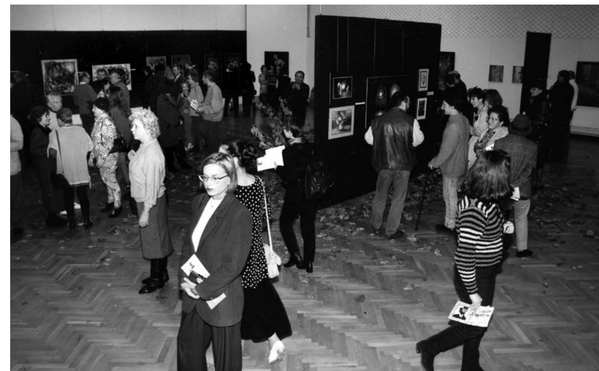
Salon Jesienny 96, listopad 1996