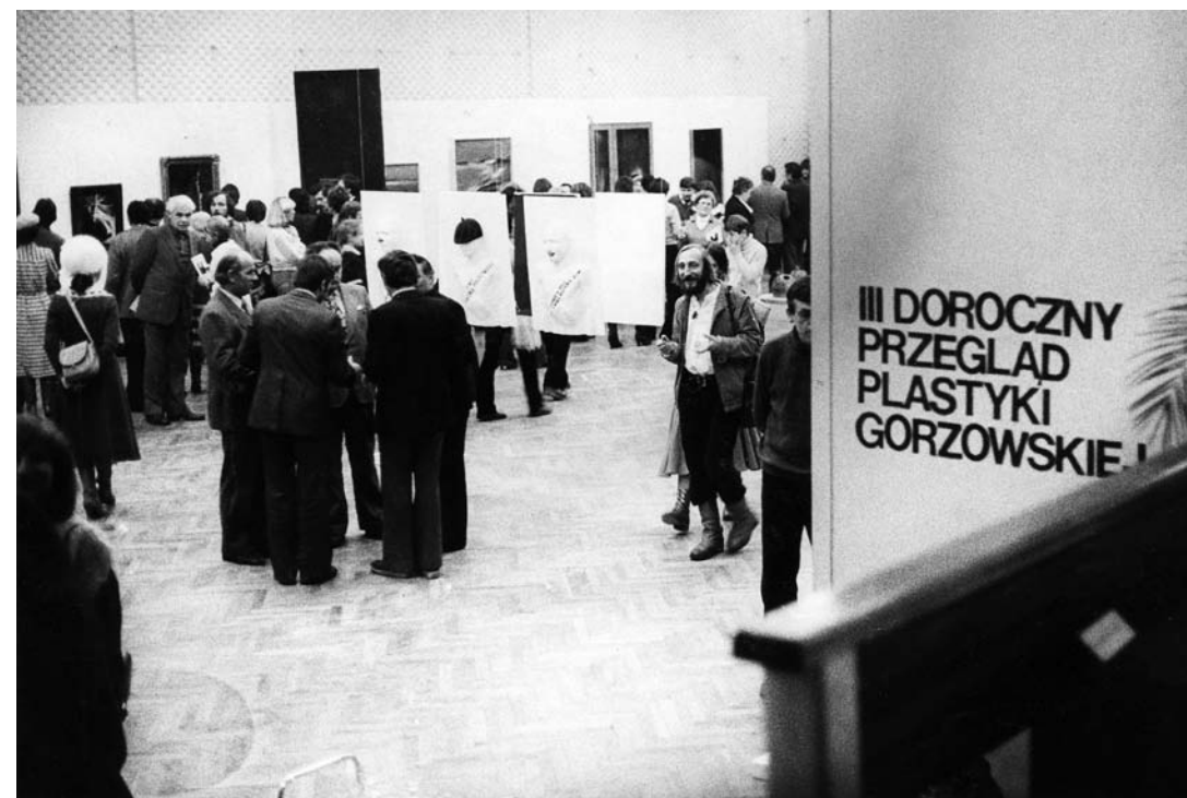
III Doroczny Przegląd Plastyki Gorzowskiej, styczeń 1981